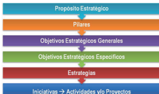
Gráfico 2: Objetivos y Estrategias del Plan Estadístico Agrario Nacional

Según este despliegue de objetivos y estrategias, se parte de definir el propósito estratégico a ser cumplido durante el periodo comprendido en el Plan Estadístico Agrario Nacional, el cual contribuye decididamente al logro de la misión y visión del SIEA.